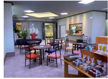
喫茶と物産コーナー