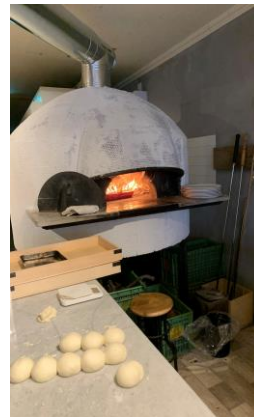
直径1.5mのピザ薪窯です