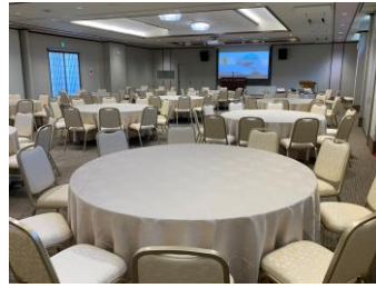
最大120人収容の多目的ホール